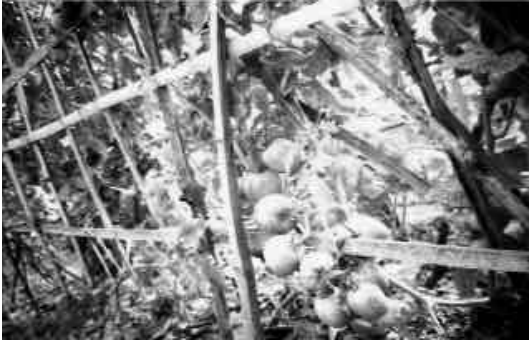
रोल्याको लिवाडमा प्लाष्टिक घरभित्र फलेको गोलभेडा

पाउने सपना बोकेर विदेश गएकाहरूमा धेरैजसो मानिसहरू दुःख पाएर विना पैसा फर्किएका छन् ।