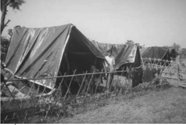
बर्दिया जिल्लामा आरआरएनबाट उपलब्ध गराइएको आपतकालीन राहत सहयोग

नेपाल ग्रामीण पुनर्निर्माण संस्था (आरआरएन)ले मनसून वर्षाको कारण उत्पन्न बाढी र पहिरोबाट विभिन्न जिल्लाका प्रभावित परिवारहरूलाई उद्धार तथा राहत सामग्रीहरू वितरण गर्दै आइरहेको छ ।