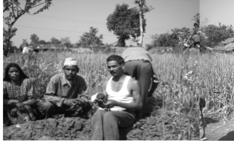
आरआरएनको सहयोगका ढिकीपम्पहरू जडान गर्दै र समुदायलाई मर्मतसम्भारको तालिम दिँदै मन्त्री चौधरी

सामन्ती दासताबाट उन्मुक्ति पाएर जमिन्दारको आगन छेउमै रहने गरेका आफ्ना बुक्राहरूबाट