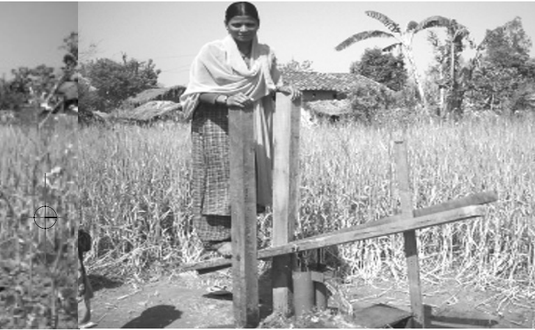
ढिकीपम्पबाट सिंचाई गर्दै एक किसान महिला

उनको ५ जनाको परिवार छ । उनी एउटा सक्रिय सामाजिक कार्यकर्ता हुन् । उनी आफ्नो शिविरको लागि रात दिन लागी पर्दछन् । उनी कम्पैया आन्दोलनदेखि हालसम्म बाणी मुक्त कम्पैया शिविरका हरेक विकासको काममा नेता भएर काम गरिरहेका छन् । बाटो निर्माण, कल्भर्ट निर्माण र ६० लाखको तटबन्धनमा पनि अध्यक्ष भएर सम्पन्न गरे । उनको अगुवाइमा नै वि.डब्लु.वि. ले श्री बाल कल्याण प्राथमिक विद्यालयको ६ कोठाको भवन निर्माण भयो । कम्पैयाका ३ सय भन्दा बढी केटाकेटीलाई बाहिर पढ्न जानु परेन ।