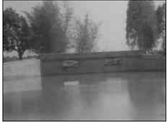
निर्माण भएको बेली सिंचाई योजना