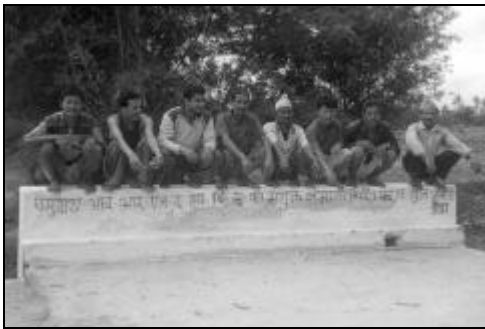
मलायो डाँडा कल्भर्ट, तोपगाछी, आरआरएन, कपा

कल्भर्ट: यस अन्तर्गत दमक, घैलाडुब्बा, कोहवरा, लखनपुर, सतासीधाम र तोपगाछीका अति विकट स्थानहरूमा ६ वटा कल्भर्ट निर्माण तथा मर्मत सम्भार गरि ७०६८ घरधुरीका ३८,८४७ जना लाभान्वित भएका छन् । उक्त योजनाहरूको कुल अनुमानित लागत रु २३,८१,५८३.३५ मध्ये संस्थाको लागत रु ५,२२,४१७.३० छ भने