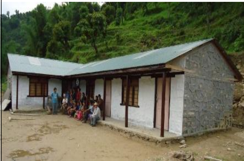
आर.आर.एन. समुदाय सहयोग कार्यक्रमको सहयोगमा निर्मित श्री बालकन्या प्रा.वि. खार्मी ९ खोटाङ ।