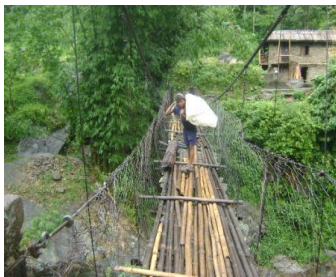
जोखिम युक्त यात्रा गर्दै