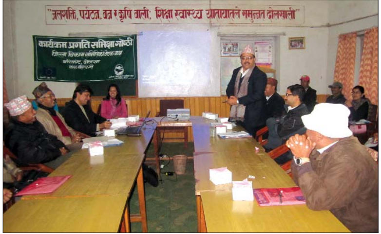
परियोजनाको जिल्लास्तरीय प्रगति समीक्षा गोष्ठी (दोलखा)

कार्यक्रममा विविध विषय तथा कार्यक्रमको वस्तुनिष्ठ ढङ्गले समीक्षा गरिएको थियो । शिक्षा क्षेत्रको नीतिगत त्रुटीदेखि विद्यालयसम्मका तहगत रूपमा नीति, कार्यक्रम र कार्यान्वयन विषयमा सबैको चासो देखिएको थियो । विद्यालय क्षेत्र सुधार कार्यक्रम र आरआरएनको कार्यक्रमको तादम्यता र समन्वयका बारेमा विशेष रूपमा ध्यानाकर्षण गरिएको थियो । बालविकास, शिक्षाको अवसरबाट बञ्चित बालबालिकालाई विद्यालय ल्याउने प्रयास, छात्रवृत्ति, सामुदायिक अध्ययन केन्द्रहरूको भौतिक तथा व्यवस्थापन सहयोग उपलब्ध गरिएको थियो । जसबाट विद्यालय तथा सामुदायिक अध्ययन केन्द्रहरूलाई कम्प्युटर र इन्टरनेटको सुविधाले गाउँमै