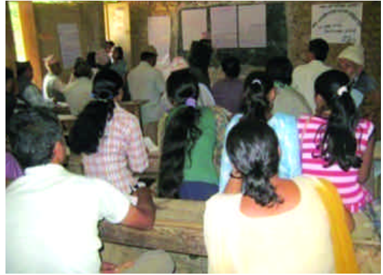
स्थानीय आवश्यकता पहिचान, प्राथमिकीकरण तथा वार्षिक कार्ययोजना तर्जुमा तालिमका सहभागीहरू, भोजपुर

यसैगरी संखुवासभाका खाँदवारी नगरपालिका, बानेश्वर र खराङ्ग गा.वि.स.हरूमा विश्व वातावरण दिवसको उपलक्ष्यमा विभिन्न समूह तथा स्कूलहरूमा शान्तिको सन्देश दिने खालका कविता, निबन्ध, गीत तथा सरसफाईका विभिन्न कार्यक्रमहरू पनि सञ्चालन गरिएको थियो । यसरी नै शान्तिसम्बन्धी सन्देश गाउँ-गाउँमा पुऱ्याउने उद्देश्यले भोजपुरको चरम्बीमा अन्तरविद्यालय स्तरीय लोकगीत प्रतियोगिताको आयोजना गरियो । यस्ता चेतना दिने खालका कार्यक्रमहरू गाउँ गाउँमा पुऱ्याउन सके ग्रामीण समुदायका जनताहरूमा चेतनाको स्तर बृद्धि भई सामुदायिक विकासमा थप टेवा पुग्ने सक्ने कुरा कार्यक्रममा उपस्थित सहभागीहरूले बताए ।