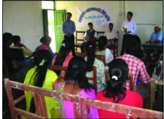
बाखापालन तथा व्यवस्थापन तालीम, भोजपुर

प्रत्यक्ष रूपले द्वन्द्वमा परेका, गरीब, महिला तथा युवाहरूलाई गाउँघरमा नै सानो व्यवसाय गरी स्वरोजगारको अवसर सिर्जना गर्ने उद्देश्यले गाउँबाट शान्ति कार्यक्रमअन्तरगत भोजपुर र संखुवासभामा ५ दिने छुट्टा-छुट्टै बाखापालन तथा व्यवसायिक तरकारीखेती सम्बन्धी आयआर्जन तथा सीपमूलक तालीम सम्पन्न