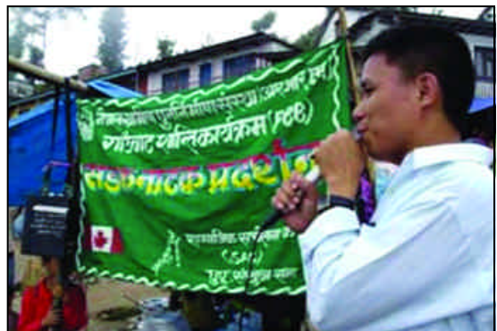
शान्तिसम्बन्धी सचेतनाका लागि सडक नाटक गर्दै, खाँदवारी

ग्रामीण समुदायलाई शान्तिसम्बन्धी जनचेतना जगाउने उद्देश्यले संखुवासभाको खाँदवारी र खराङ्ग बजारमा 'शान्तिको बाटोमा' शीर्षकको सडकनाटक प्रदर्शन गरिएको छ।