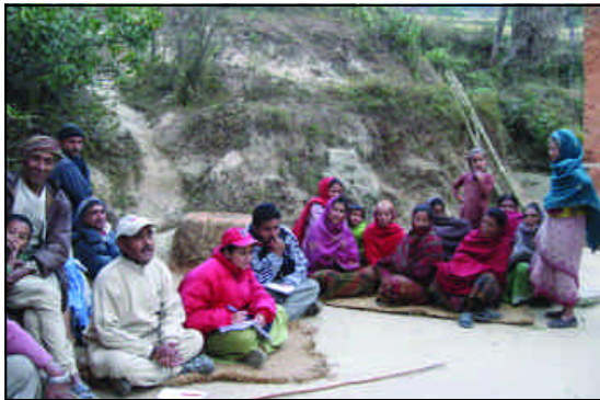
आधारभूत सर्वेक्षण, तिवारीभन्ज्याङ, भोजपुर

प्रारम्भिक चरणमा कार्यक्रम अन्तर्गत भोजपुरको तिवारीभन्ज्याङ, चरम्बी र जरायोटा र गा.वि.स. र संखुवासभाको खाँदवारी न.पा. वडा नं. १० राम्चे, खराङ्ग र बानेश्वर गा.वि.स.मा आधारभूत सर्वेक्षण गरिएको थियो । यस सर्वेक्षणले उल्लेखित गा.वि.स.हरूको आर्थिक, सामाजिक, राजनैतिक स्थितिका साथै एक दशक लामो द्वन्द्वबाट भएका क्षति तथा प्रभावहरूको यथार्थ स्थितिको आँकलन, अवलोकन र भावी दिनमा आउनसक्ने द्वन्द्वहरूको बारेमा पनि विश्लेषण गरिएको थियो । सर्वेक्षणको क्रममा घरधुरी सर्वेक्षण, समूह छलफल तथा सुमदायमा अगुवाई गर्ने व्यक्तिहरूसँग छलफल गरी सुमदायमा आधारित संघ-संस्थाहरूको क्षमता मूल्याङ्कन पनि गरिएको थियो ।