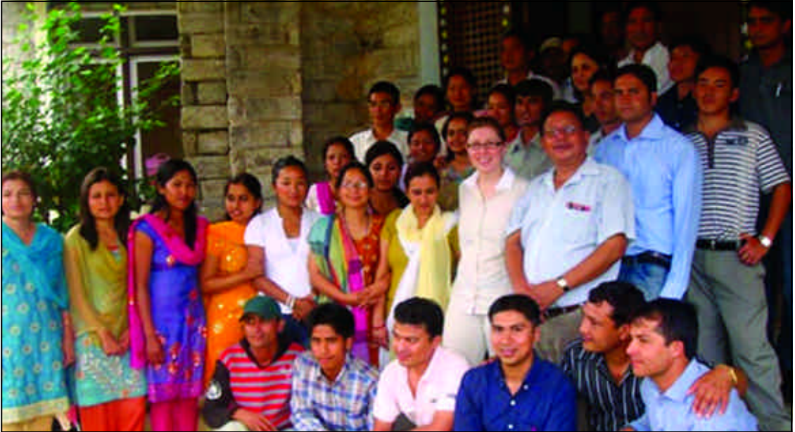
कार्यक्रम अभिमुखीकरण गोष्ठीका सहभागीहरू, सामुदायिक अध्ययन तथा तालीम केन्द्र, तुम्लिङटार, संखुवासभा

त्रैमासिक बुलेटिन (वर्ष १, अंक १, भदौ २०६६)