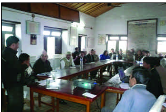
जिल्लास्तरीय सरोकारवालाहरूको बैठक

गाउँबाट शान्ति कार्यक्रम अन्तर्गत जिल्लास्तरीय सरोकारवालाहरूसँगको बैठक यहीं २०६५ पुस १६ गते