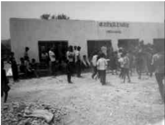
आरआरएनको सहयोगमा निर्माण गरिएपछि विद्यालयको अवस्था, दाङ्ग

रात्रि प्राथमिक विद्यालय, गोवर्द्धिया गाविस वार्ड नं-४ पचाहाको स्थापना २०३५ सालमा भएको थियो । मध्यपश्चिमाञ्चल दाङ्ग जिल्ला, राप्ति नदीको दक्षिण भेगमा पर्ने यस विद्यालय थारु